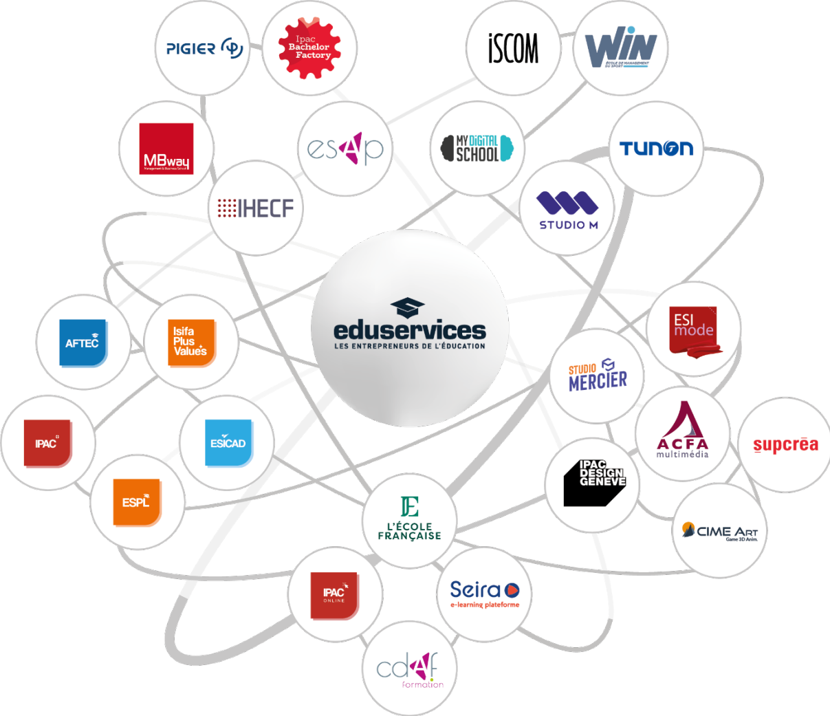
SCHÉMA DE L'ALLIANCE EDUSERVICES