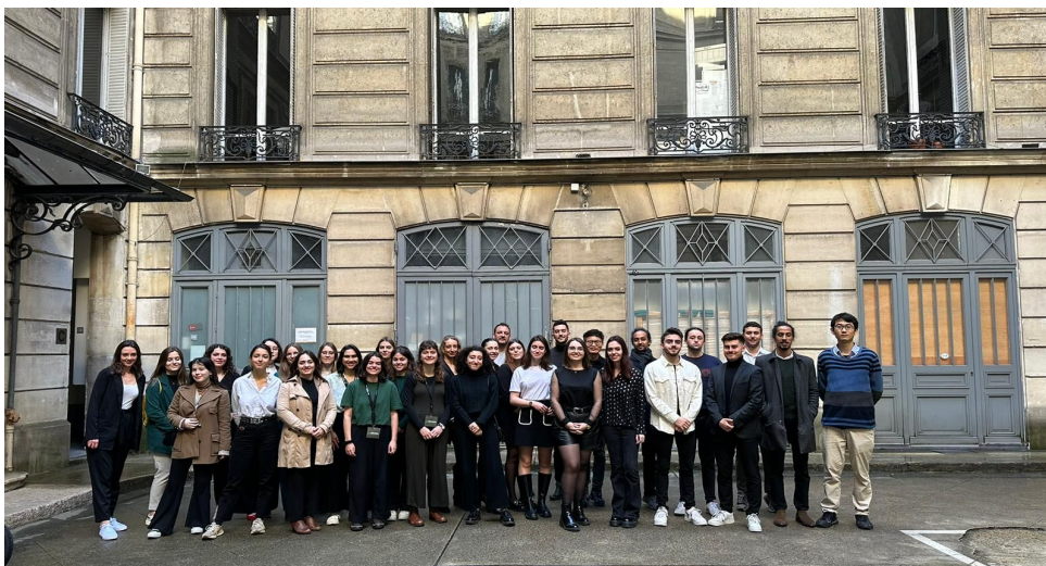
10 équipes de finalistes du New Explorer Challenge