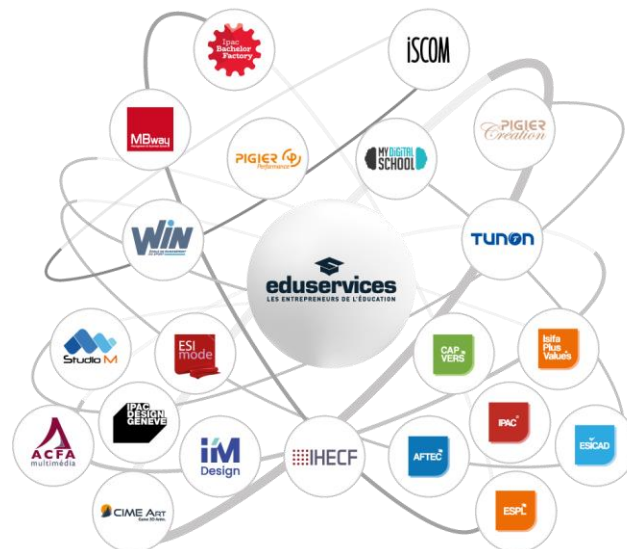
SCHÉMA DE L'ALLIANCE EDUSERVICES :

Ecole de l'Alliance EduServices, MyDigitalSchool est l'école en 5 ans, hors Parcoursup, des métiers du digital, créée en 2016. Les 6 formations Bachelors et 7 MBA forment aux métiers du marketing digital, community management, e-commerce, WebDesign, création numérique et développement. 2 000 étudiants sont formés dans ses 18 campus français : https://www.mydigitalschool.com/